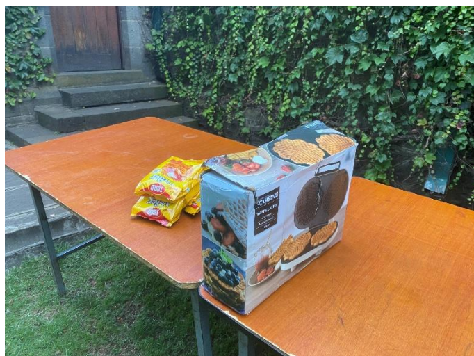
Sjømannskirken er alltid beredt til kirkekaffe med vafler!