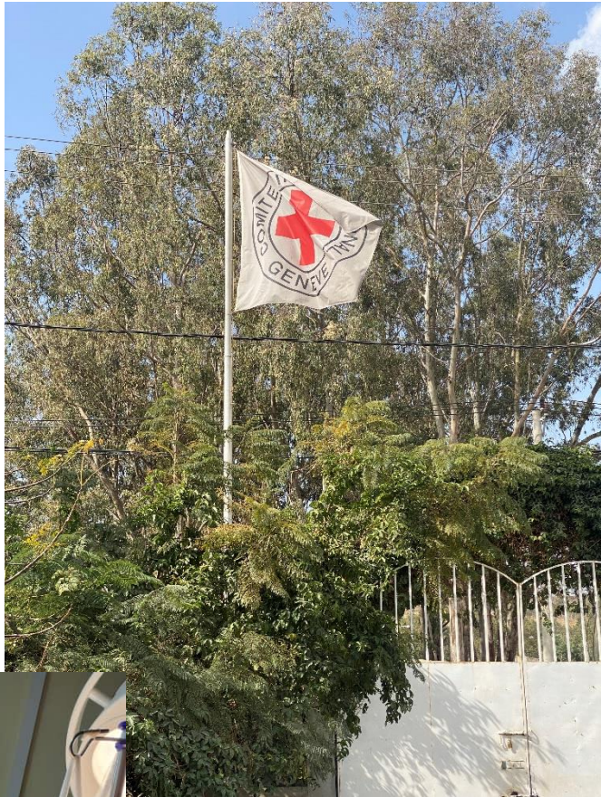
International Committee of the Red Cross

Etter borgerkrigen i Etiopia var det tusenvis av skadde pasienter på begge sider, de fleste unge. Det gjorde stort inntrykk å se alle de unge menneskene som måneder og år etter at konflikten sluttet, fremdeles ventet på kirurgi.