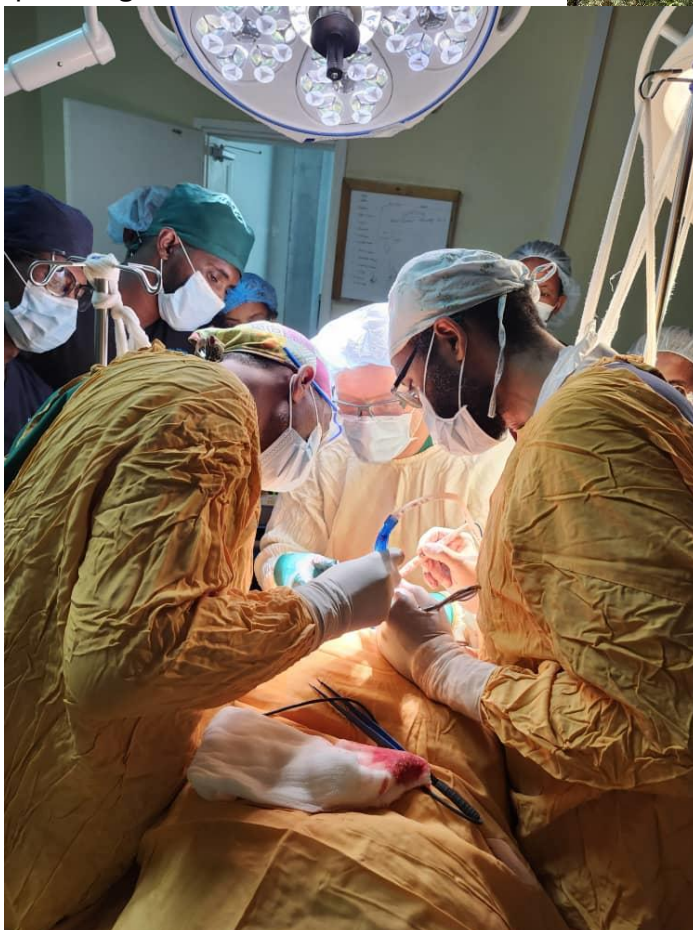
Jeg opererer på Ayder sykehus

De fleste hadde ortopediske skader, men flere med svært kompliserte mage / tarm problemer. Mange av disse med fistler fra tarm der tarminnholdet rant ut av hull ulike steder på magen, med slike skader blir mange av pasientene avmagret og dermed enda vanskeligere å operere.