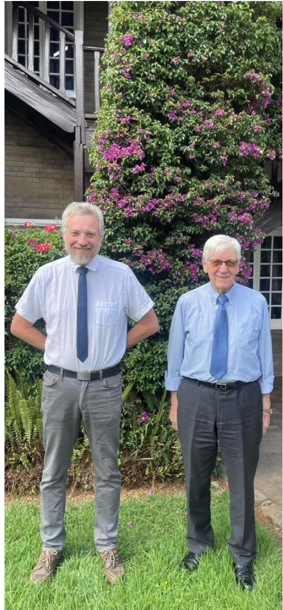
Her har vi tatt på finstasen før vi skal besøke ambassaden!

I Addis opererte jeg på grunn av et ønske om å legge tilbake utlagt tarm etter en operasjon for endetarmskreft. Det var allerede prøvd før å legge tilbake tarmen, men det