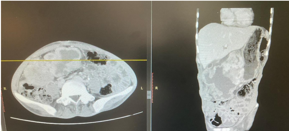
CT bilder av gigantisk svulst fra magesekken

I Addis var jeg også med på en operasjon der vi fjernet en stor svulst fra magesekken, en GIST. Svulsten var så stor at det dyttet bort magesekken og tarmene, pasienten må ha gått med den ganske lenge.